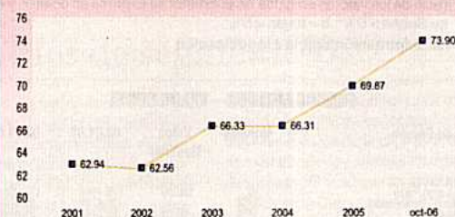
Indicador de Concentración de Colocaciones (Datos en % a diciembre de cada año)