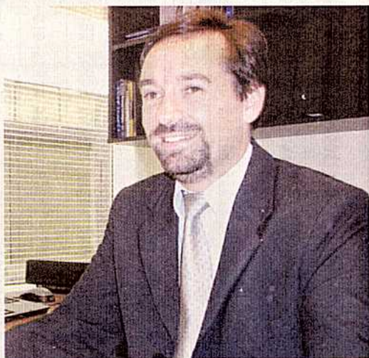
El Perú es el país de Latinoamérica que muestra las mayores cifras de concentración bancaria de depósitos para el banco más grande, sostiene estudio en el que participa Miguel Angel Martín.

Además detalla que el 77.27% de los depósitos de la banca múltiple se encuentra en sólo tres bancos, y cinco de las restantes entidades del sistema bancario cuentan con participaciones individuales inferiores al 3%.